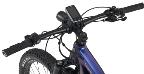
フラットハンドルバー (740mm)

操縦安定性の高いアルミ製740mm (※4) 幅のフラットハンドルバーを採用し、快適なオフロード走行を可能としています。前後スルーアクスル構造のホイールにより、ねじれ剛性を高めハードな走りにも対応。前後ともローター径180mmの油圧式ディスクブレーキは、制動性能を高めています。ハイエアボリュームの27.5×2.8HEワイドタイヤにより、オフロード走行時の走破性と安定感を向上させました。