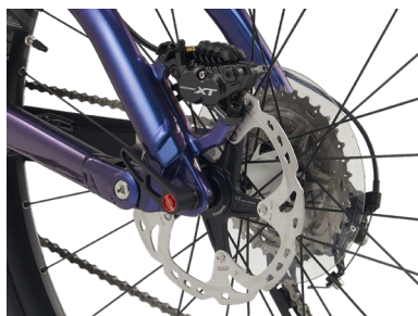
前後スルーアクスル & 180mmディスクローター