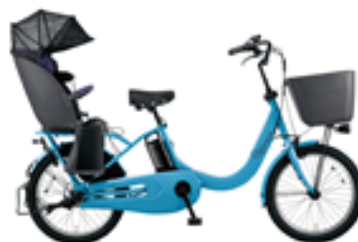
【ギョット・クルームR・DX (BE-ELRD03)】