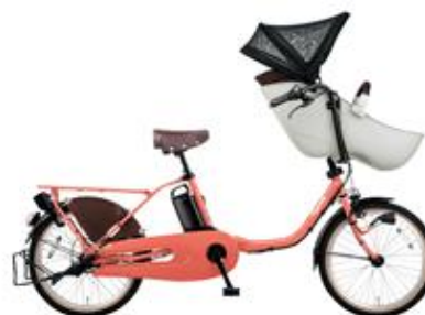
【ギョット・クルーム・EX (BE-ELFE032)】

上記の製品写真は「Panasonic Newsroom Japan」(URL: http://news.panasonic.com/jp/press/ )の各リリースのページよりダウンロードができます。