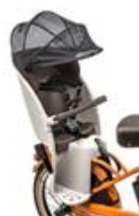
【クルームリヤシート】