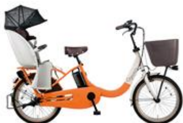
【ギョット・クルームR・EX (BE-ELRE03)】